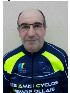
Orgeur Didier Gestion site internet